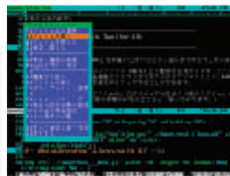
▲全画面テキストモード